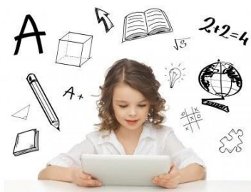
Slika 6: Logiko in informatiko približati mladini

http://videolectures.net/posvetRIN2017_stanovnik_informatika/