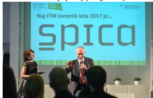
Slika 3: Podelitev nagrade za izvoznika leta 2017 (agencija SPIRIT Slovenija)

Majhna podjetja so bila v tistih časih izvozno najbolj uspešna v radiju 500 km. In tudi Špici smo geografsko najprej postavili svoje bazne tabore – svoja podjetja v glavnih mestih regije LJ, ZG, BG, SA, SK ter vzpostavili partnersko sodelovanje s podjetji v Romuniji, Bolgariji in Madžarski. Z biometrično identifikacijo pa smo se uspešno prebili tudi na trge Bližnjega Vzhoda, kjer so še danes naše največje implementacije Evidenca delovnega časa in kontrole dostopa v podjetjih preko 10.000 zaposlenih. Že leta 2002 smo postavili tudi zelo napredno web storitev www.myhours.com ki je izredno uspešna predvsem v Ameriki in je neke vrste podlaga za našo današnjo uspešno metamorfozo v SaaS podjetje. Leta 2017 smo prejeli laskavo nagrado IZVOZNIK LETA, ki jo podeljuje organizacija SPIRIT