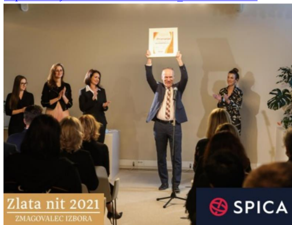
Slika 7: Dvakrat na vrhu ZLATA NIT 2020 in 2021. Zaposlovalec leta med srednje velikimi podjetji

https://www.youtube.com/watch?v=3cm_ZX0v2R8&t=93s