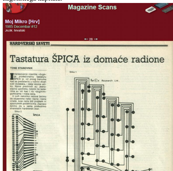
Slika 1: Članek objavljen 1985 v takrat sveži reviji Moj Mikro

To je bilo obdobje, ko si morali imeti svoj Punk bend ali pa vsaj mikroročunalniško delavnico v garaži . Ker še ni bilo možnosti, da bi kar odprl podjetje, sem pa imel nekaj inovativnih idej, sem se znašel tako, da sem v ŠKUCu takrat na Kersnikovi 4 dobil kartico svobodnega umetnika, kot so jo dobili vsi takratni Punk bendi. Tako smo lahko kupovali potrebno opremo in material brez davka. Seveda smo tudi takrat potrebovali inicialno investicijo in ker ni bilo investorjev za vsakim vogalom kot so danes, sem se znašel tako, da sem noč in dan na ulicah prodajal takrat zelo popularno Tribuno in Mladino ter posebej v decembrskem času, ko so ljudje bolj radodarni, prišel do nujnega zagonskega kapitala.