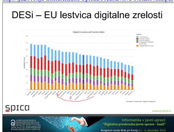
Slika 5: DESI lestvica 2016 z ponazoritvijo planiranega preboja naprej v naslednjih 10 letih.

http://iju2016.iju-konferenca.si/Upload/Predstavitve/T.Stanovnik.pdf