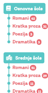
Slika 2: Tipologija e-knjig v sBiblosu (zajem zaslona)

Tudi baza e-knjig, ki so brezplačno na voljo za učence in dijake v platformi sBiblos zajema literarna besedila, kot je razvidno s Slike 2.